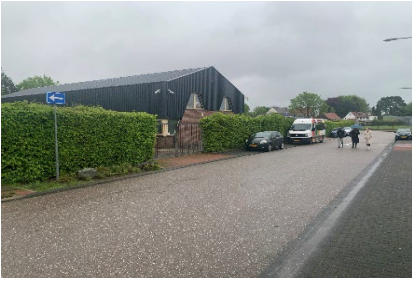
Groen bij gemeentewerf