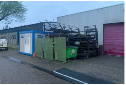
Buitenopslag bij nr. 37