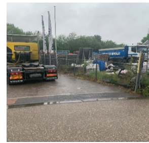
Kapot hekwerk Van Lo