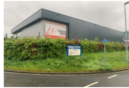
Groen bij Eussen